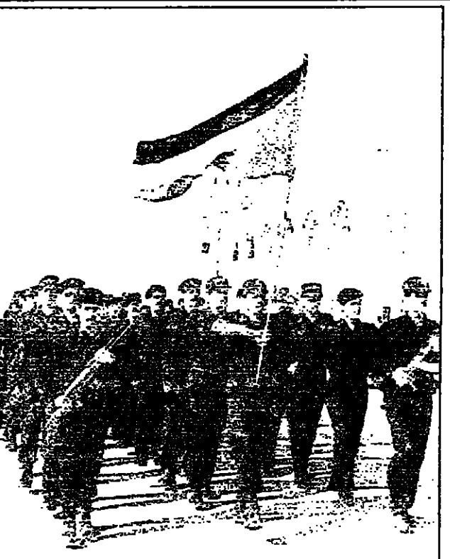
الشرطة الفلسطينية تقوم بمسيرة في بلدة الظاهرية استعدادا للانتشار في مدينة الخليل

بالخير والرخاء على شعوبها وقد قدم سيادة الرئيس الفلسطيني ورئيس الوزراء الاسرائيلي تهنيتهما الى جلالة الملك الحسين بعيد ميلاد جلالاته واشادا بجهوده الخيرة وحكمته السديدة وحرصه الموصول لدفع عملية السلام قدماً